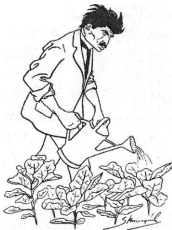
12. Karykatura Macieja Rataja wykonana przez Zygmunta Skwirzyńskiego. zamieszczona w albumie „Gabinet Witosy”. Warszawa 1920

Obejmując ministerstwo Wyznań Religijnych i Oświecenia Publicznego spotkał się z atmosferą uprzedzenia i niechęci jakoby rolę Rataja (nieznanego w tym środowisku) będzie przyoranie i przysypanie ziemią kultury polskiej. Wystarczyło jednak jedno spotkanie Rataja z personelem Ministerstwa, by na jego temat plotki i niewczesne dowcipy znikły bez śladu.