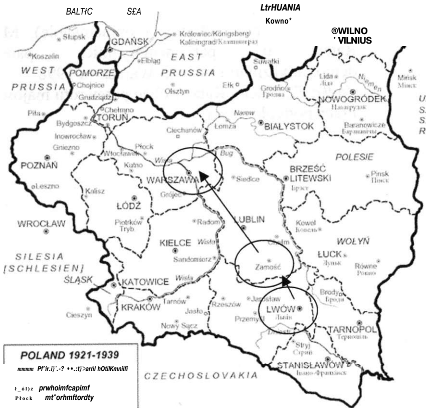
- Miejsca zamieszkania i pracy Macieja Rataja